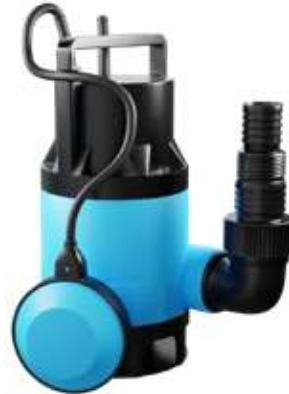
IP 400 MINI